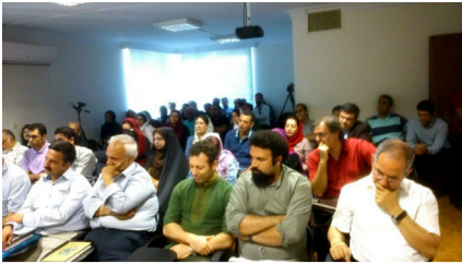
• نقد کتاب زندگانهان • تاریخ کوروش پارسی • نهاد، قدرت و هنر

اندیشه‌ی ایرانی و یونانی را خاطرنشان کردند.